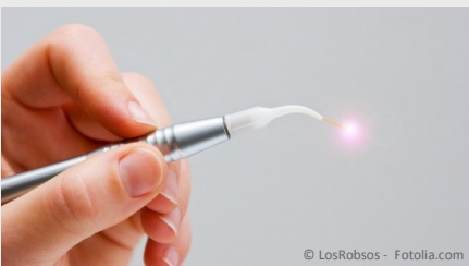
Laser: Gebündeltes Licht

Das ist aber noch nicht alles: Die Wundheilungszeit verkürzt sich ebenfalls. Das bedeutet, dass Sie weniger Nachschmerzen haben und wieder schneller fit sind. Außer für operative Eingriffe am Zahnfleisch können Dioden-Laser noch für viele andere Zwecke vorteilhaft genutzt werden. Welche das sind, erfahren Sie im Folgenden: