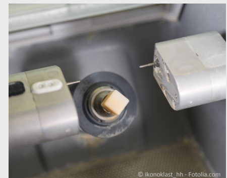
Das Inlay wird innerhalb weniger Minuten aus einem Keramik-Block gefräst.

Diese Technik spart nicht nur Zeit, sondern auch Geld: Weil kein Abdruck, kein Provisorium, kein Zahntechniker und kein zweiter Termin notwendig sind, können solche Inlays preisgünstiger angefertigt werden.