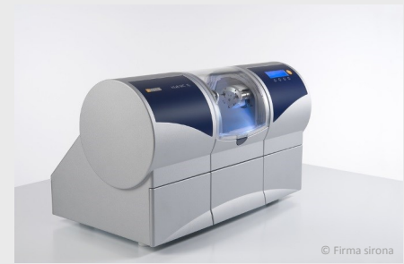
Schleifgerät für Inlays, Kronen und Brücken aus Keramik

Diese Inlays sind sehr stabil, bewährt und haltbar. Untersuchungen zeigen, dass sie so lange wie Gold-Inlays halten. Seit 1985 wurden mit dieser Methode weltweit über 20 Millionen Keramik-Inlays hergestellt und eingesetzt.